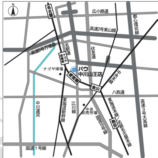
< パウ中川山王周辺案内図 >

名称：「パウ中川山王」 所在地：愛知県名古屋市中川区山王 4丁目5-5 交通：東海道本線尾頭橋駅下車、徒歩5分 開店予定日：2003年8月19日（予定） 営業時間：午前10時～翌午前5時 （店舗によって異なります。） 売場面積：2702.3㎡ （内ドン・キホーテ 1658.68㎡） 店舗構成：地上4階建て （営業施設は1、2階） 駐車台数：202台 駐輪場：56台