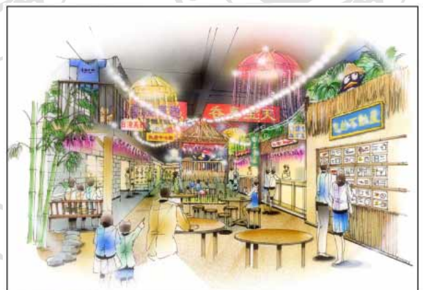
フードコート イメージ図 内観イメージ図

「パウ中川山王」は、アジアのお祭りをミックスしたイメージの店内で、年中お祭りのような空気をかもしだしています。キーテナントである激安の殿堂「ドン・キホーテ」に加え、個性豊かなテナント群が集結。100円ショップの大手「キャンドゥ」や、日本テレビの人気番組「マネーの虎」から生まれた、原宿の超人気ファーストフード「ロコロール」、広島発・激辛つけ麺を提供する「ばくだんや」、480円という低価格でカツ丼を堪能できる「かつや」、深夜営業の美のサロン「nina」「癒し屋あらむちゃら」など、深夜を楽しく過ごして頂けることと存じます。