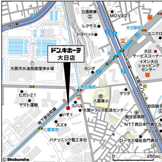
「ドン・キホーテ守口大日店」周辺地図