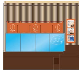
「こしらへ」ショップイメージ

厳選素材を使用し、できたて・てづくりのおいしさを追求したインショップ。店内では、毎日てづくりのおにぎりを提供します。おにぎりは、流通量が少なく市場にほとんど出回らないため幻の米と呼ばれる“多古米”を、水素水（電解還元水）で炊き上げたこだわりの逸品です。