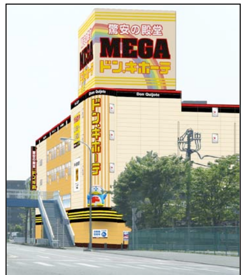
「MEGA ドン・キホーテ新横浜店」外観