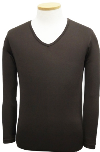
メンズストレッチ9分袖Tシャツ 吸汗速乾素材(異形断面糸)で、汗をかいても乾きやすく、快適な着心地が持続。

両商品とも、8月24日(水)より店頭発売を予定しております。今後もお客さまの声を元に、市場にはない新たな価値を付加したアイテムを積極的に開発してまいります。「情熱価格」の新たなラインナップにご期待ください。