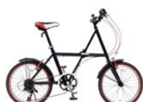
パッションブラック