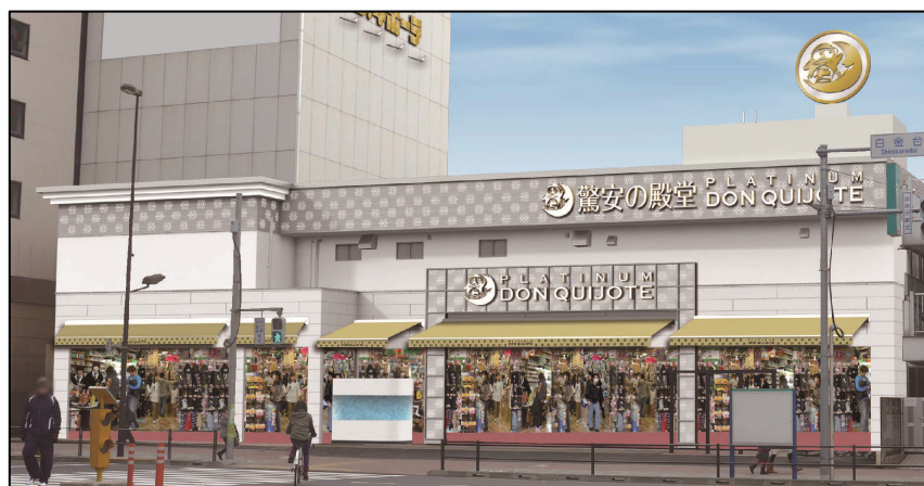
「プラチナ ドン・キホーテ白金台店」外観イメージ

「プラチナ ドン・キホーテ白金台店」は24時間※、『ワクワク・ドキドキ』のお買い物の楽しさを提供し、末永く地域の皆様にご愛顧いただける店舗を目指します。