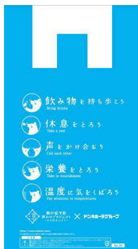
熱中症予防啓発のためのコラボレジ袋を制作・配布

った企業に与えられる『最優秀声かけ賞 外国人部門』を2年連続で受賞することができました。