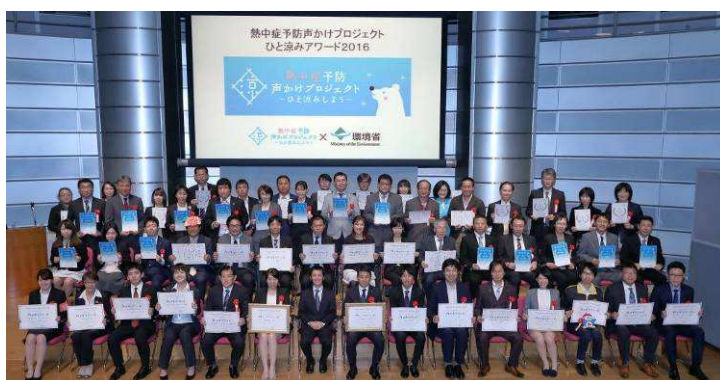
「ひと涼みアワード2016」表彰式

今後も小売業としてお客さまとの接点を大切に、訪日客対応のノウハウや店舗インフラを最大限活かしながら熱中症予防の声かけを継続し、日本で安心・安全・快適に過ごしていただくための“ドンキ流おもてなし”を追求してまいります。