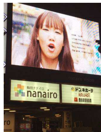
啓発動画を店頭ビジョンで放映

熱中症予防声かけプロジェクト ホームページ http://www.hitosuzumi.jp/