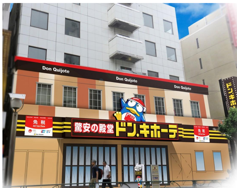
【ドン・キホーテ新大久保駅前店イメージ】