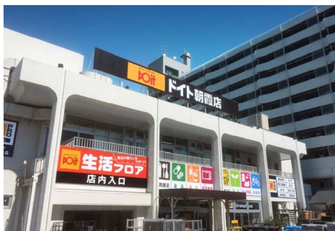
ドイト朝霞店 外観イメージ

ドイト朝霞店は、プロユーザーの多様なご要望と、地域のお客さまの幅広い需要にお応えしながら、末永くご愛顧いただける店舗を目指します。