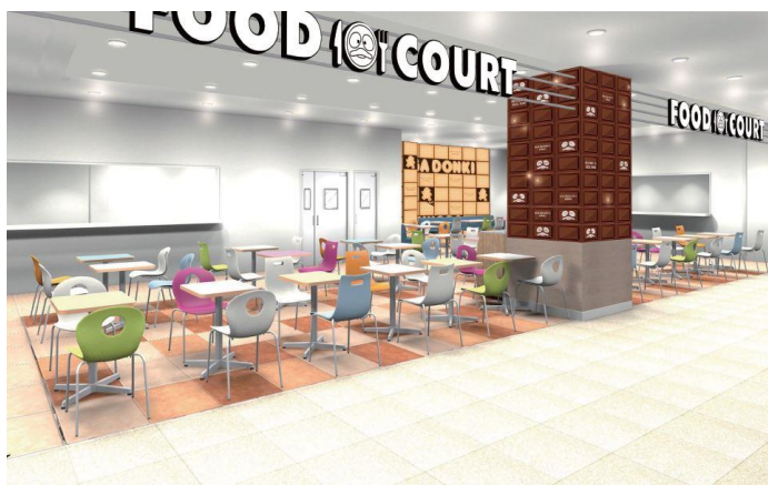
MEGAドン・キホーテ札幌篠路店 フードコートイメージ