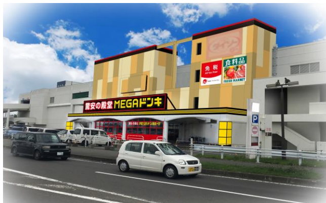
MEGA ドン・キホーテ札幌篠路店 外観イメージ

同店は、市場や契約農家の地場野菜をはじめ、漁港から新鮮な魚介類を直接仕入れるなど、品質・鮮度にこだわった生鮮4品（青果・鮮魚・精肉・惣菜）を含めた食品部門を充実させるほか、日用消耗品などの生活必需品を地域最安値を目指した“驚安（きょうやす）価格”で提供します。また、同施設内のスポーツクラブ利用者をはじめ、健康志向の高いお客さまのニーズにもお応えできるようランニングシューズやトレーニングウェア、プロテインといったスポーツ用品の品揃えを強化します。その他、周辺に小学校や保育園などが多い立地特性から、玩具・学童文具・子供服などのキッズ商品も数多く取り揃えます。