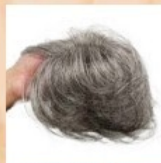
分け目ミシン(白髪)