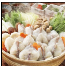
国産天然ふぐのちり鍋セット 2,980円(税込)