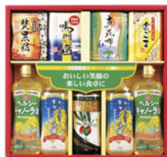
日清ヘルシーキャノーラ油& バラエティギフト 3,150円(税込)