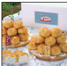
北海道シューアイス 2,980円(税込)