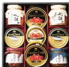
シーフードバラエティギフト 3,150円(税込)