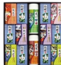
名湯旅情 薬用入浴剤セット 2,625円(税込)