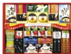
バラエティセレクトギフト 2,625円(税込)