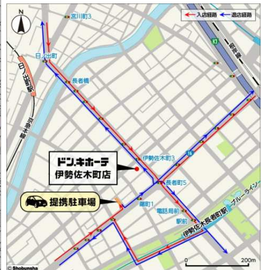
「ドン・キホーテ伊勢佐木町店」 提携駐車場 入退店経路図