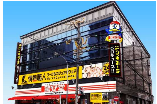
「驚安堂 日ノ出町店」外観イメージ