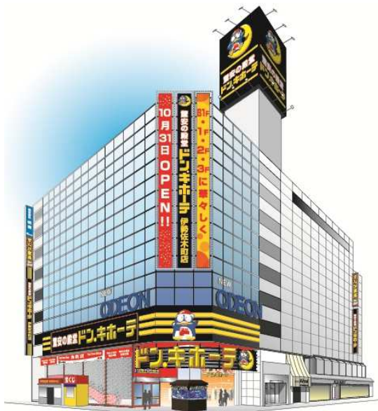
「ドン・キホーテ伊勢佐木町店」外観イメージ