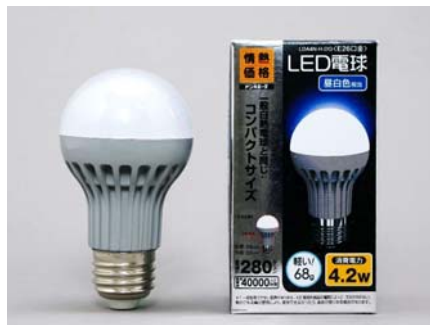
LED電球 40W相当 昼白色