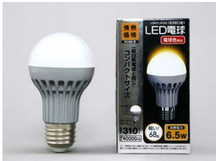
LED電球 60W相当 電球色

長寿命・低消費電力という、環境にも家計にも優しい明りで、ドン・キホーテはさらなる社会貢献を目指してまいります。