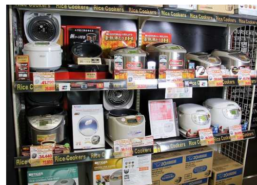
←ようこそ館のイメージ ↑人気の炊飯器