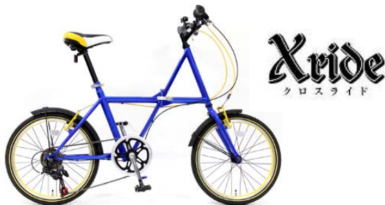
スポーティーブルー

また、ご購入後の乗り心地に合わせて車両整備を行う「1カ月無料点検サービス」もご用意。各種機能を多彩に備え、18,800円というお買い得価格で提供いたします。ぜひこの機会に「情熱価格」の折畳自転車をお試しく下さい。