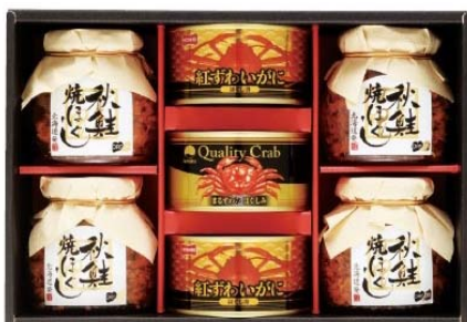
ホニホ&マルハニチロ シーフードギフト 2,625円(税込)