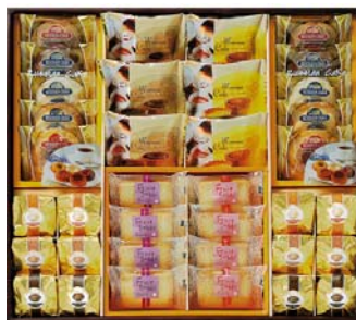
中山製菓ガトーセックト 2,520円(税込)