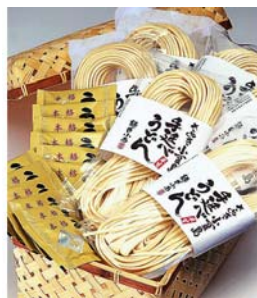
麵匠小西手延べ半生うどん 2,980円(税込)