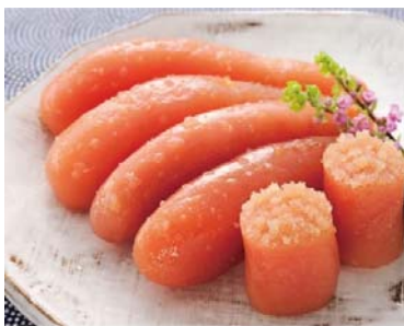
博多めいこう無着色辛子明太子 2,980円(税込)