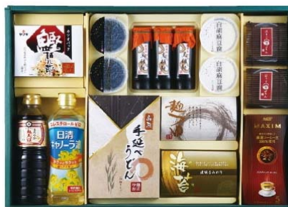
バラエティセレクトギフト 2,625円(税込)