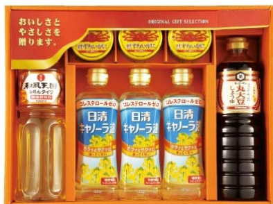
キッコーマン&ニッスイ バラエティギフト 2,835円(税込)