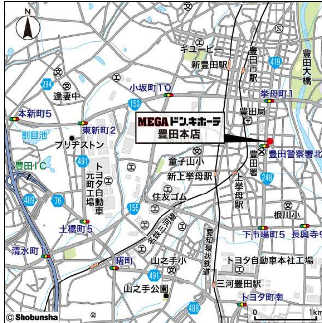
「MEGAドン・キホーテ豊田本店」周辺地図