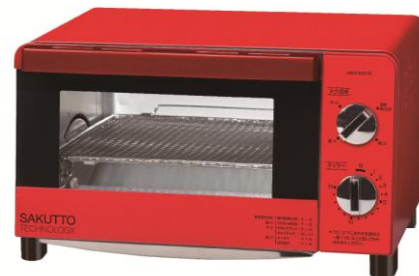
『ビッグ庫内オーブントースター』¥4,980（税抜）

本品は、大きな庫内のオーブントースターで、食パンは4枚同時に、ピザは25cm(10インチ)サイズを焼くことができます。さらに本品ならではの特長として、独自開発した付属の「サクッとネット」を使用すると、冷めると油でベタベタになりがちな揚げ物などの惣菜をサクサクの食感に復活させることができます。「サクッとネット」は、脚付のネットで上げ底になっています。ネットの下に受け皿をセットし、赤外線を上から当てることで、油を下に落とし水分を効率よく蒸発させて、サクサク感を再現します。