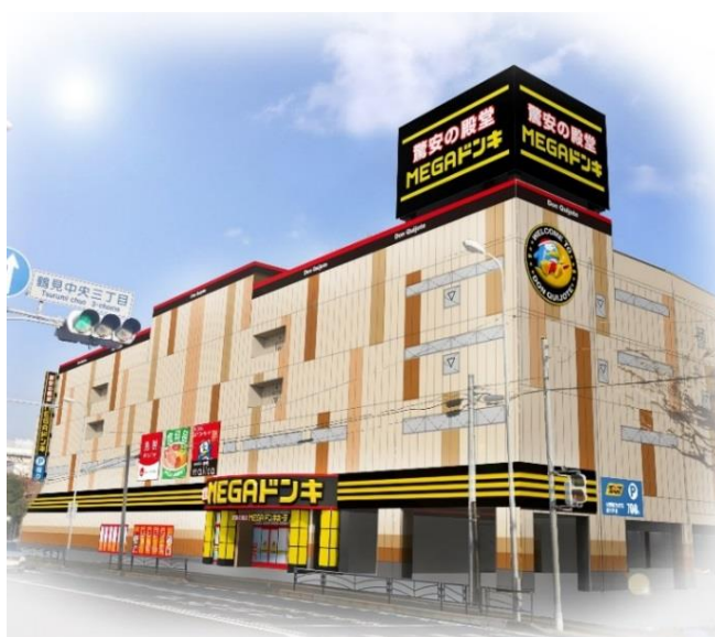
【MEGAドン・キホーテ鶴見中央店 外観イメージ】

「MEGAドン・キホーテ鶴見中央店」は、お客さまにお買いものの『ワクワク・ドキドキ』を提供する店舗空間の創造に努めるとともに、地域の皆さまに末永くご愛顧いただける店舗づくりを目指します。