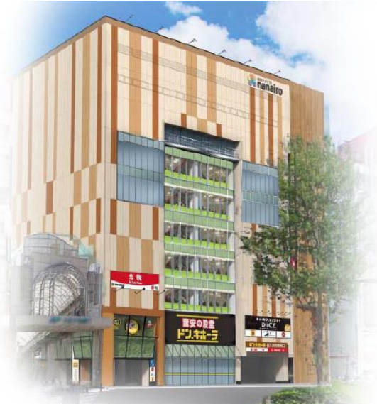
「ドン・キホーテ仙台駅西口本店」外観イメージ