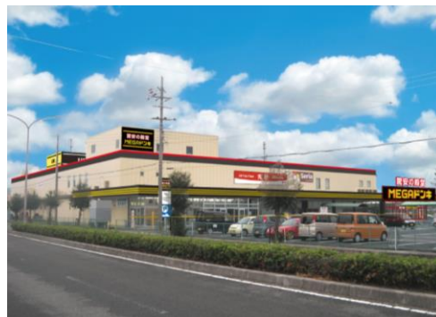
MEGAドン・キホーテUNY東近江店 周辺地図