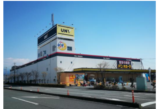
ドン・キホーテUNY富士中央店 周辺地図

名 称 : 「ドン・キホーテUNY富士中央店」 旧 店 名 : ピアゴ富士中央店 営 業 時 間 : 午前9時～翌午前2時 所 在 地 : 静岡県富士市青葉町 625 交 通 : JR身延線「豎堀駅」から徒歩約20分 開 店 日 : 2019年4月23日(火) 午前9時 売 場 面 積 : 5,159 m 2 (直営部分) 建 物 構 造 : 地上2階建 商 品 構 成 : 食品、酒、日用消耗品、家庭雑貨品、衣料品、 化粧品、玩具、カー用品、ブランド品、 家電製品、ペット用品、他 駐 車 台 数 : 291台