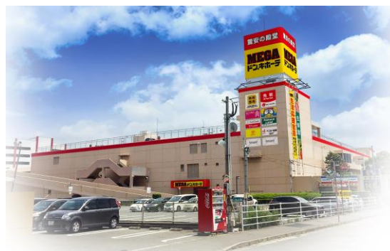
MEGAドン・キホーテ福岡福重店 外観イメージ

PPIHグループは、地域の活性化に寄与していくとともに、お客さまに『ワクワク・ドキドキ』しながらお買い物を楽しんでいただける空間の創造に努めてまいります。